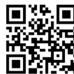
つうえんポータル

右記の2次元コードを読み込み、つうえんポータルにアクセスし、その画面にてお住まいの自治体を選択し、利用申請をしてください。